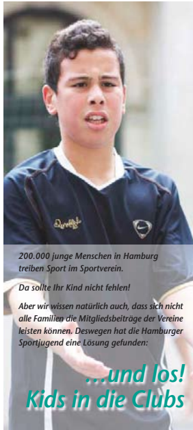
200.000 junge Menschen in Hamburg treiben Sport im Sportverein.

Denn wir möchten, dass alle Kinder und Jugendlichen Sport im Verein betreiben!